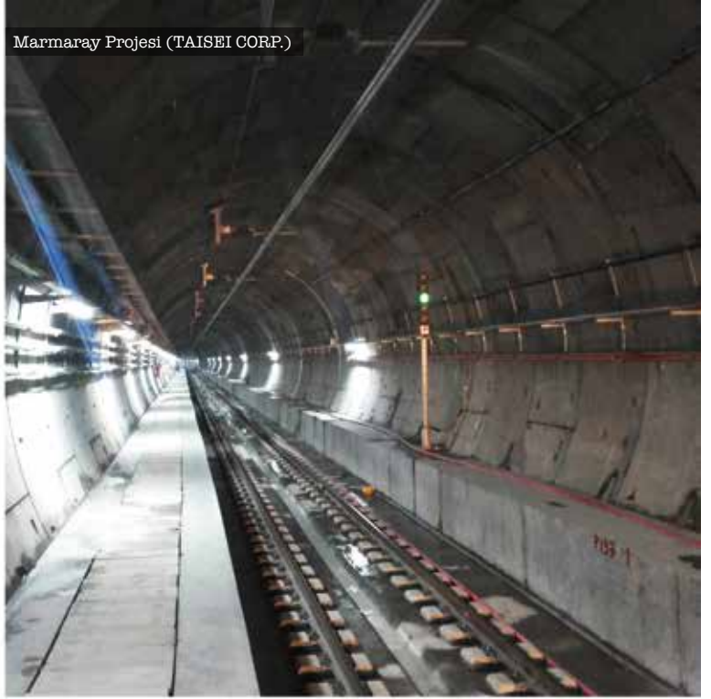
Marmaray Projesi (TAISEI CORP.)