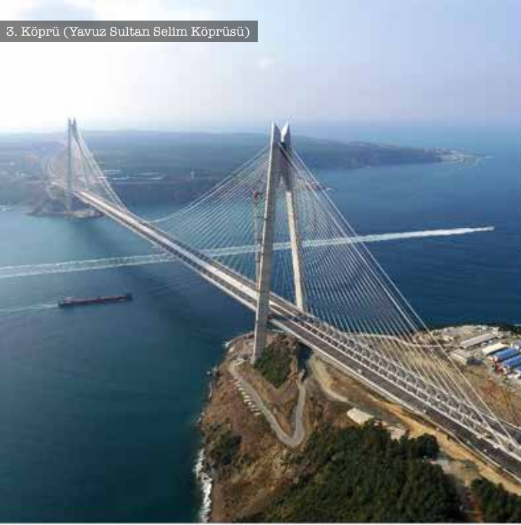
3. Köprü (Yavuz Sultan Selim Köprüsü)